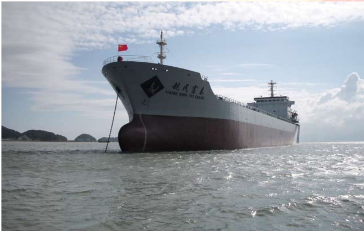
航民村拥有三艘千散货轮，载重能力达6.5万吨