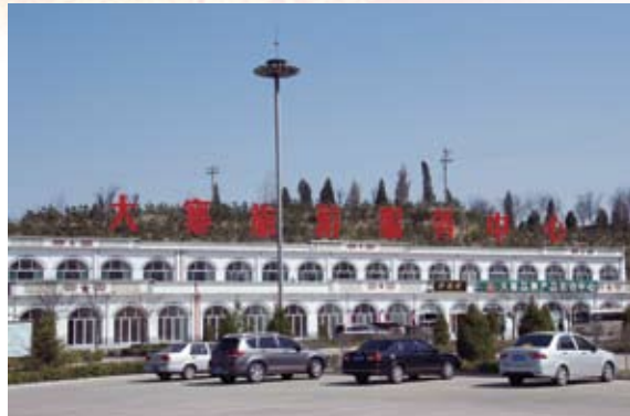
④ 大寨旅游服务中心