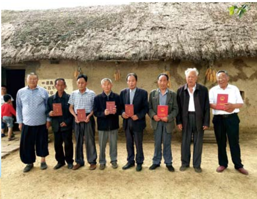
❷ 40年后，大包干带头人在“当年农家”前合影