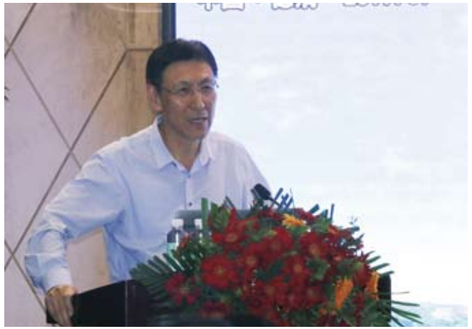
中国农业大学原校长柯炳生作报告

题的内涵进一步聚焦，为与会代表展示各自经验成果，寻求先进资源和智慧支持提供了更精准的平台。有关方面的高水平企业和30余位参会代表分别在各自分论坛上分享了先进经验成果，同时也抛出了发展中遇到的问题，获得了有关嘉宾的点评和解答。