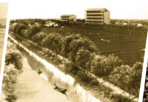
❶ 上世纪80年代华西村