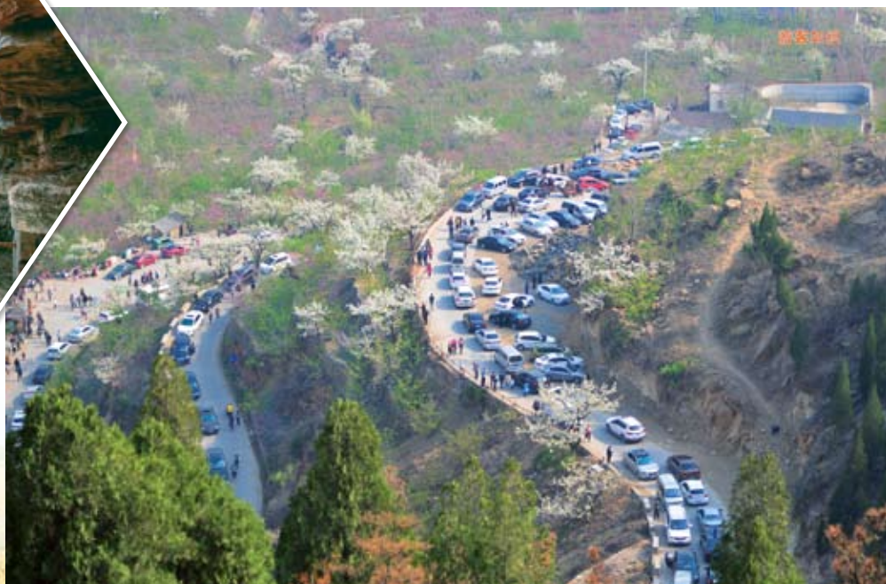
② 如今来九间棚参观旅游的人越来越多