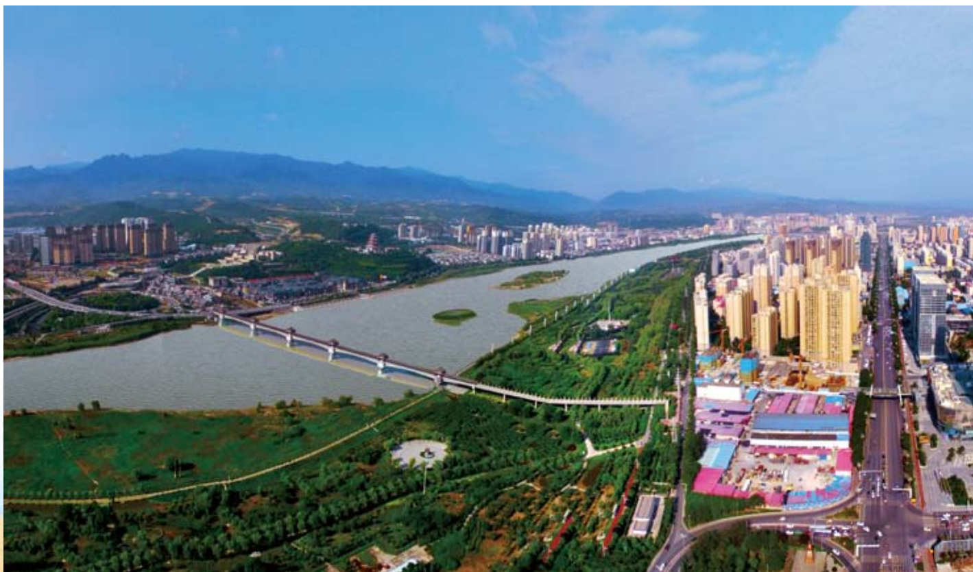
2018年7月，东岭村航拍全景

“村东村西水汪汪，村前河滩白茫茫。半年糠菜半年粮，有女不嫁东岭郎”这是改革开放前东岭村的真实写照。改革开放前，东岭村是远近闻名的贫困村，人均