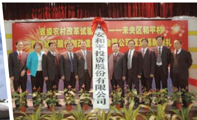
⊙ 2009年3月27日，西安和平投资股份有限公司揭牌成立

融入了城市化。村集体资产由改造前的1.5亿元猛增至6亿余元。2018年，村集体年可支配收入超过5600万元，集体给村民各类分配人均超过1.5万元，普通家庭人均年收入均超4万元。特别是47万平方米高品质住宅的建成使用和教育、医疗、商业、文旅、地铁等一大批市政民生项目落地，吸纳了5万人的就业和生活，村域产业完全转入城市商业、服务业等三产为主、多元化可持续的