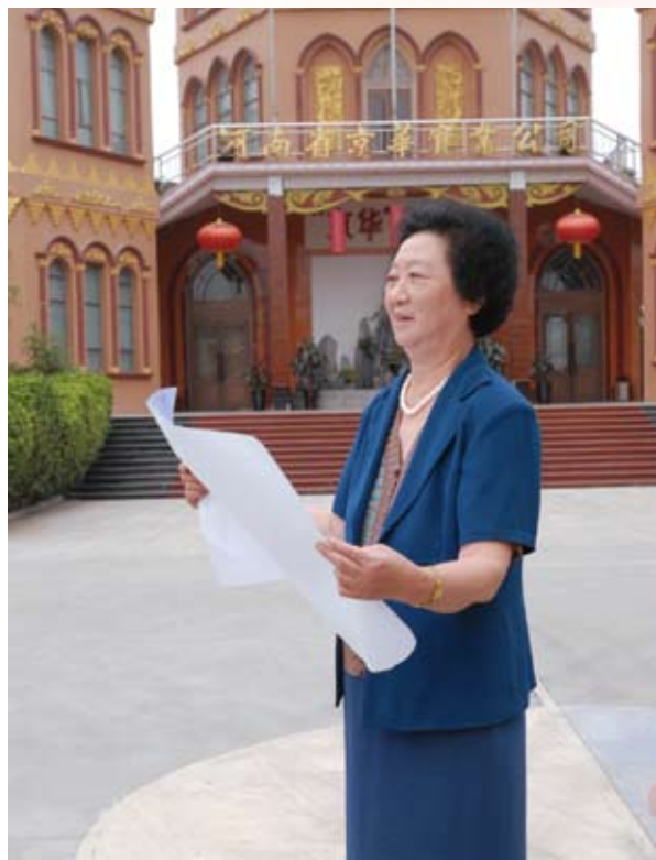
第十三届全国人大代表刘志华

乘着改革开放的强劲东风，京华实业公司于1984年成立，是京华村的集体企业，下属有10个经济实体，有京华园景区、京华宾馆、京华矿泉疗养院、京华矿泉度假村、京华矿泉养生苑、京华幼儿园、京华实验小学、京华镁业有限公司、京华集贸市场、京华建材市场，职工近2000人。京华公司和京华社区分别荣获“全国文明乡镇企业”“全国农业旅游示范点”“全国新农村建设百强示范企业”“全国生态文化村”“中国乡村旅游模范村”“河南