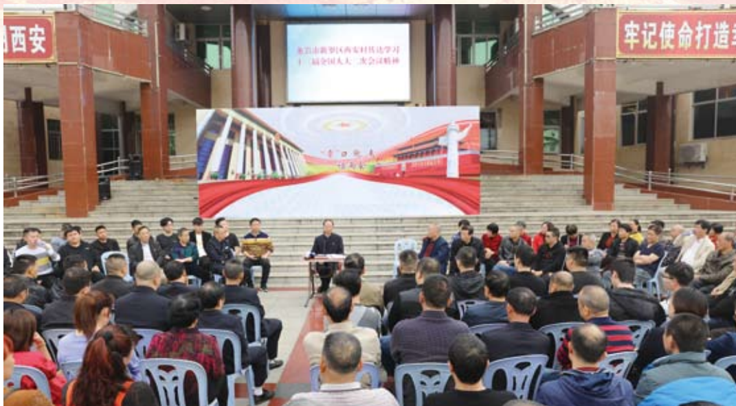
① 传达十三届全国人大二次会议精神

万元建设村基础设施，先后新修村道12条，新铺水泥路面16条，建起综合文化活动广场、农民科技文化图书室、广播室、老年人活动室、党员活动室等；投资400多万元兴建西安幼儿园，投资500多万元兴建闽西村级第一楼——西安村委会服务大楼和文体广场；率先在闽西红土地上成立了一支由退伍军人组成的村级“民间110联动队”，还配备了警用电瓶巡逻车，并以“110联动队”为基础，在全省率先成立首支民间消防队——西安村义务消防队，配备了1台大型消防车和2台小型消防车和各类消防器材以及电动巡逻车，承担辖区内的24小时治安巡查和安全消防、宣传巡查及灭火救助等；成立了全市第一个村级警务室和电子监控室，在辖区市场、交通要道等重点地段安装了“电子眼”，实现了24小时全天候监控，形成立体化全方位的监控网络，构建了立体防务体系，并建立了首个村级综治中心。持续提升村民的获得感幸福感安全感。