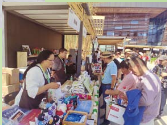
特色农产品展销会