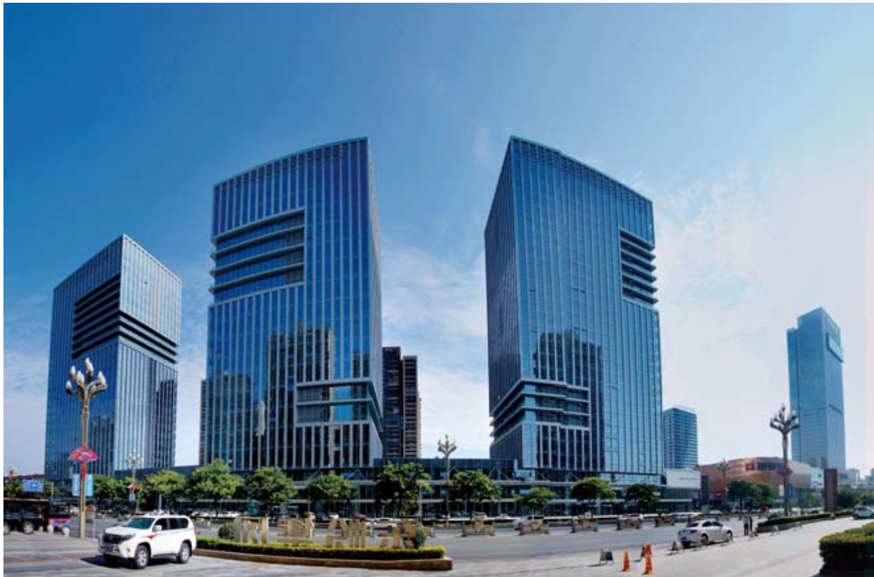
❶ 东岭集团投资开发的宝鸡中央金融文化商务区

文明小区楼群达到34栋，彻底改变了东岭村的面貌。配套村（社区）公共服务中心，建造了供村民休憩、观赏、游览的苏式“和园”，推动村民生活品质不断提升。