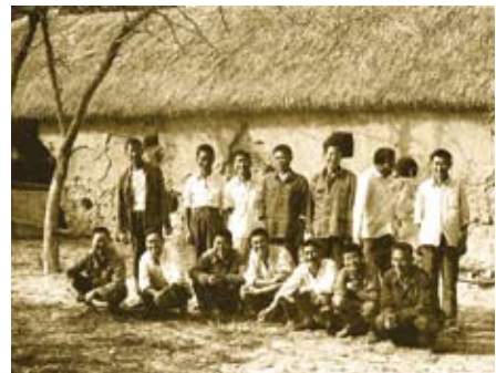
❹ 40年前，大包干带头人在茅草屋前合影