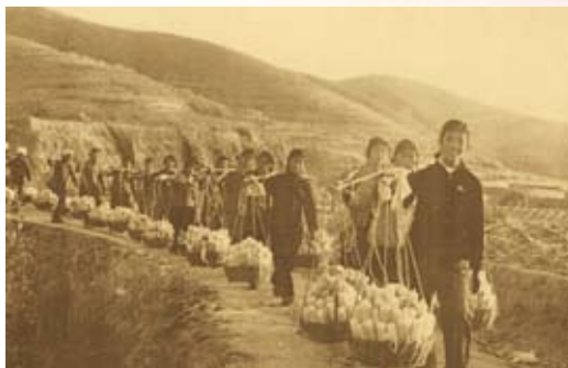
① 艰苦奋斗的大寨人

与时俱进抓改革，是推动大寨绿色发展的根本动力。改革开放以来，特别是进入新时代以来，每一次农村改革的到来，大寨都抢占先机，不断推动大寨发展实现新跨越。实行包产到户的农村改革，把农民从土地中解放出来，大寨利用充足的劳动力资源加快了