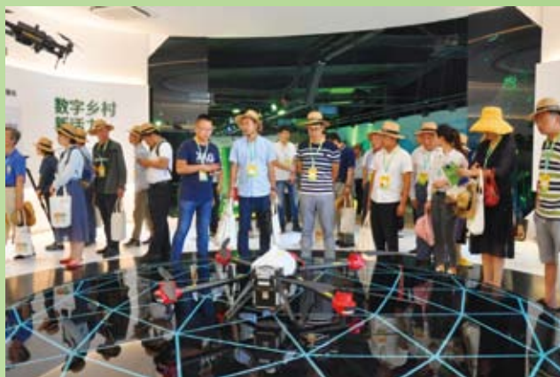
德清馆数字乡村展区吸引嘉宾驻足