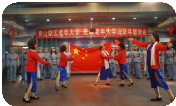
① 绣红旗——进顺老年大学迎新会