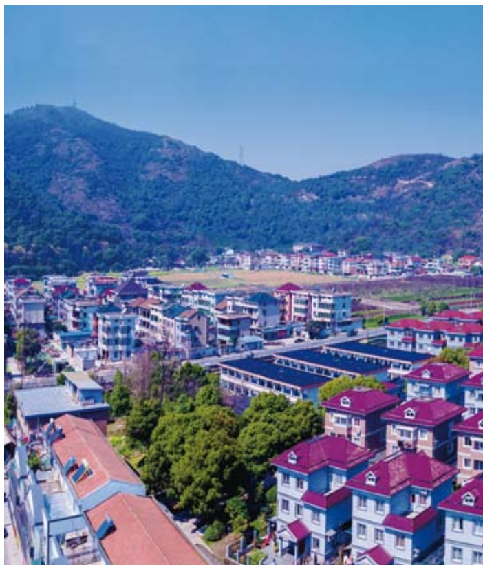
幸福美丽的航民村