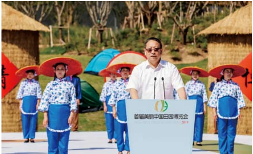
① 全国政协副主席、民革中央常务副主席郑建邦出席并宣布开幕

田园博览园，在美丽田园中国馆、湖州馆和德清馆内，学习浙江“千万工程”和乡村振兴的实践经验与成果。