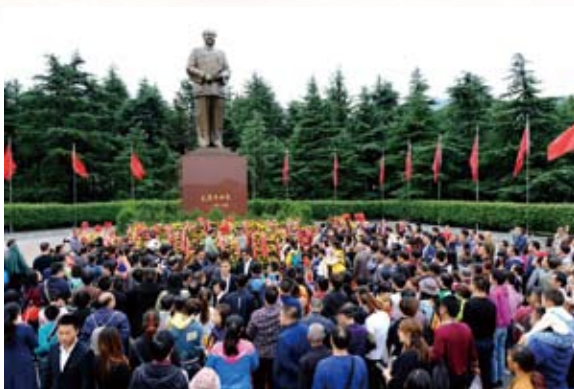
瞻仰一代伟人毛泽东铜像