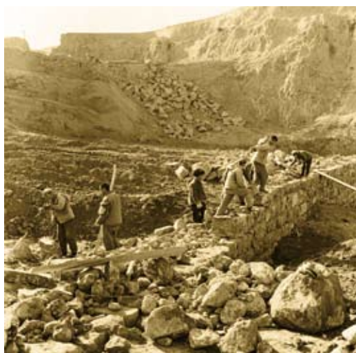
② 当年大寨人在垒石塔

荒山绿化；建立市场经济体制的农村改革，把农业和二第三产业融合起来，大寨积极调整产业结构，培育发展了大寨绿色产业，壮大了集体经济；统筹城乡发展的农村改革，把农村和城市融合起来，大寨加快了新农村建设，融入了大县城。特别是实施乡村振兴战略，激活农村新动能，为大寨快速发展插上了腾飞的翅膀。大寨“两委”班子按照习近平总书记“五个振兴”“七条之路”总要求，全面深化以农村土地制度、集体产权制度、供给侧结构为重点的农村改革，加快培育新型经营主体。通过资产转让，组建了大寨旅游开发有限公司、大寨针织制衣有限公司，盘活了集体闲置资产，做大了生态旅游产业，做活了服装加工产业；通过土地流转，组建了大寨园林绿化有限公司、大寨“绿草湾”种养殖发展有限公司，大寨“美好之家”现代农业产业示范园，做强了绿色生态产业，做大了规模养