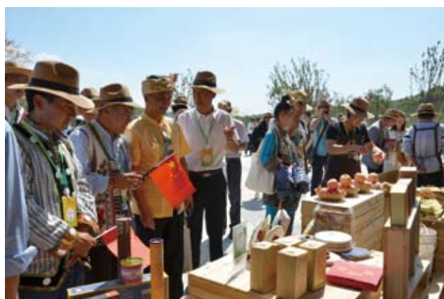
参观田博会少数民族特色产品展