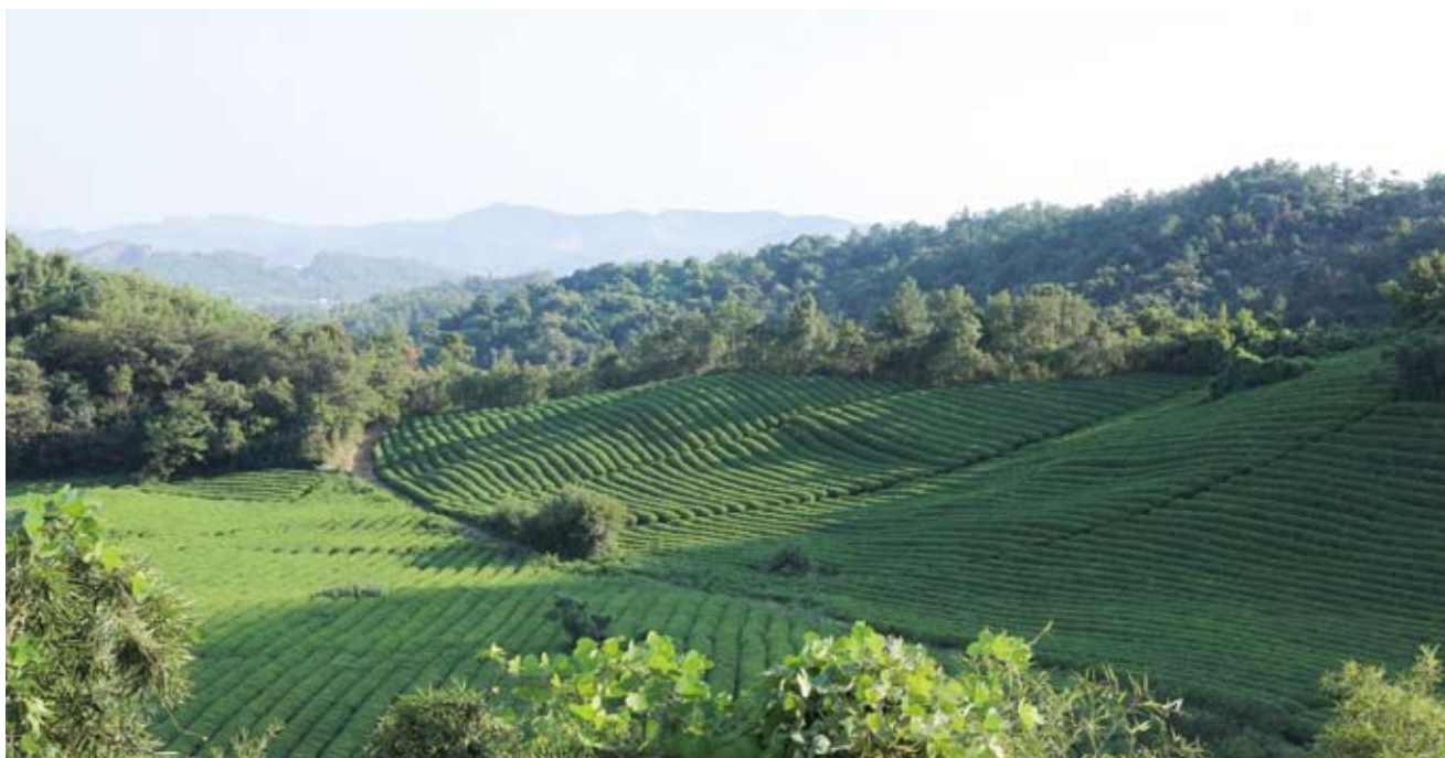
德清田博会室外展区生态茶园