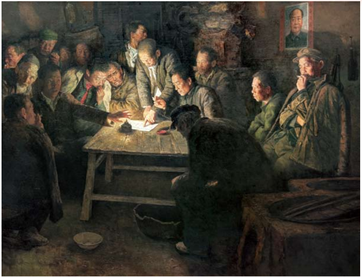
❶ “红手印” 油画