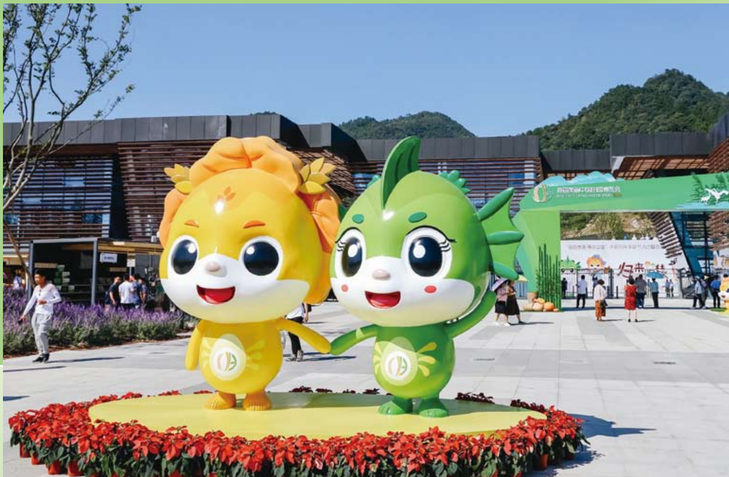
博览会的吉祥物与主场馆