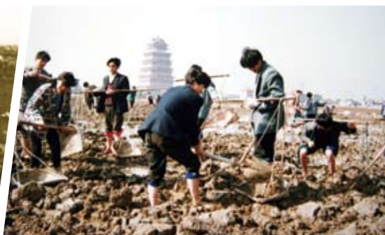
❶ 上世纪90年代华西村