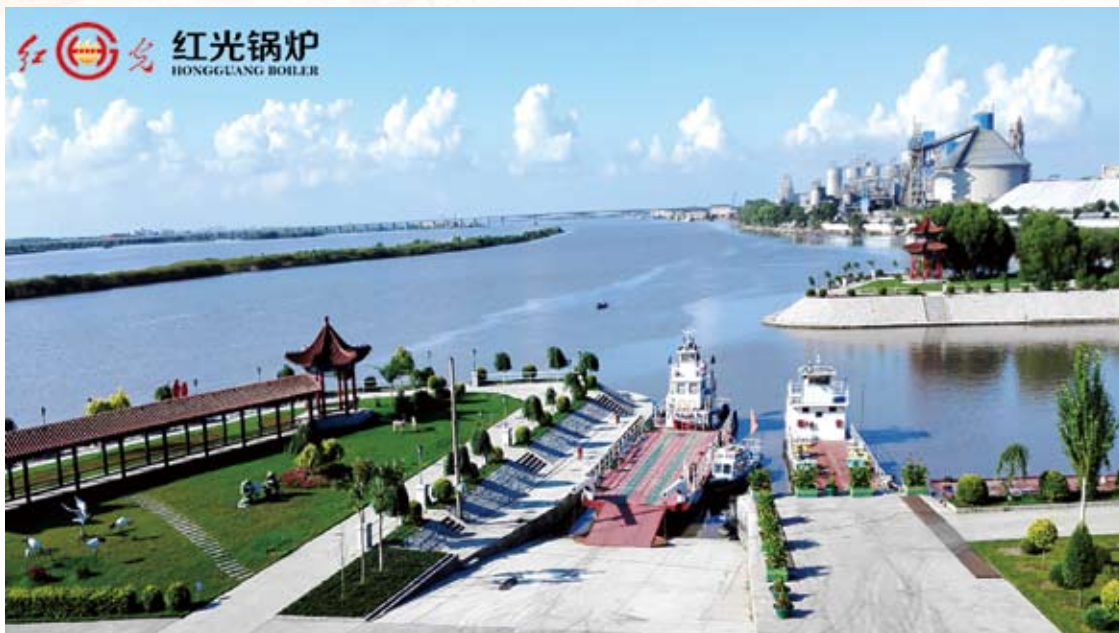
④ 红光村松花江小港湾风光

了起来。当时作为村书记兼厂长的我工资仅为74元，而其中有两位女焊工的工资竟是每人720元，是我的近10倍。这大大激发了生产一线工人按劳取酬的积极性，企业连续五年以每年递增50%的速度爆发式发展。当初我们村办集体企业红光锅炉厂，是哈尔滨工业锅炉行业最小最差最破的老疙瘩，如今已发展成为国家级高新技术企业，成为东北地区最大的工业锅炉和风电塔架制造企业，晋级中国工业锅炉行业1700多家企业的前十强，风电塔架制造已位居全国的前三强，兑现了当年“全国争一流、全省争排头、全市争第一”的誓言。