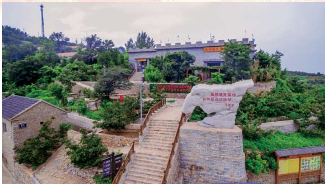
① 九间棚，风景这边独好