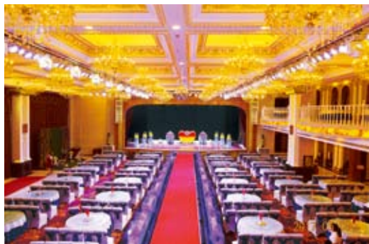
京华国际婚礼主题酒店