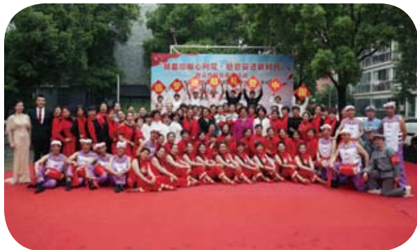
② 追梦进顺，礼赞中国