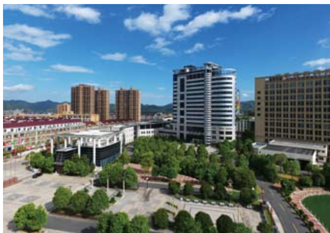
中国民营企业500强——花园集团