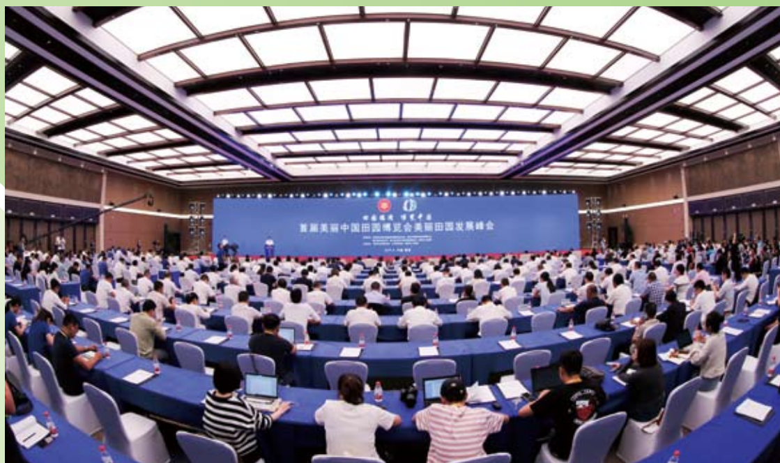
美丽田园发展峰会现场