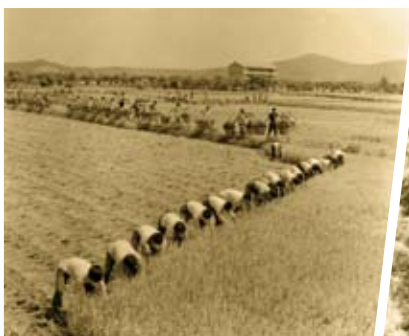
❶ 上世纪70年代华西村